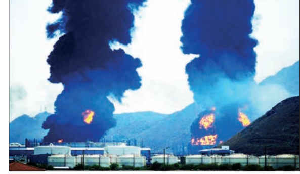
दोन्ही देशांनी परस्परावर हल्ले सुरु केल्याने होर्मुझ जलमार्गातील वाहतूक पूर्वपादावर येण्याची आशा मावळली

अमेरिकेच्या वायुदलाने होर्मुझ किनाऱ्याजवळील इराणच्या अब्बास बंदरालगतच्या लष्करी तळावर आणि नौकांवर केलेल्या हल्ल्याला प्रत्युत्तर म्हणून इस्लामिक रिझल्व्यूशनरी गार्ड कार्पसने गुरुवारी होर्मुझजवळील अमेरिकेचे वायू तळ आणि कुवेतमधील लष्करी तळावर क्षेपणास्त्र, ड्रोनचा मारा केला. त्यानंतर अमेरिकेच्या सैन्यानेही इराणी लष्कराच्या तळावर हल्ले चढविल्याने मध्यपूर्वेत पुन्हा युद्धाची परिस्थिती निर्माण झाली आहे.