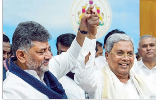
पत्रकार परिषदेत सिद्धरामय्या आणि डी. के. शिवकुमार यांनी हातात हात घेऊन काँग्रेसमध्ये आलवेल असल्याचे संकेत दिले