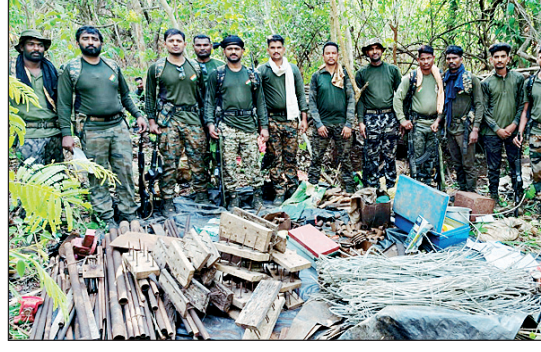
जप्त करण्यात आलेले शस्त्रनिर्मिती साहित्य

गडचिरोली पोलिस आणि नारायणपूर पोलिसांच्या संयुक्त आंतरराज्यीय अभियानात माओवाद्यांचा शस्त्रनिर्मिती कारखाना उद्ध्वस्त करण्यात आला असून, मोठ्या प्रमाणात शस्त्रसाठा आणि स्फोटक साहित्य जप्त करण्यात आले. आत्मसमर्पित माओवाद्यांकडून मिळालेल्या गोपनीय माहितीच्या आधारे ही कारवाई करण्यात आली.