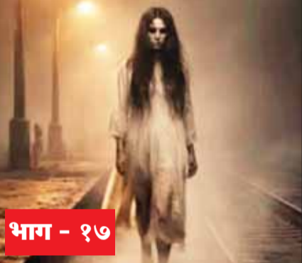
भाग - १७

दोन्ही हात एकत्र करून रथने प्रतिकार करण्याचा शेवटचा प्रयत्न केला. तिने तिच्या चेहऱ्यावर नखं रोवली. त्या झटपाटीच्या त्या तरुणीच्या मिळ कोटची वस्त्रे तीन बटाणं उघडली गेली. ती गाणं गुणगुणू लागली. ‘रिंगा रिंगा रोझेस...पॅकेट फुल ऑफ पोझेस...’ गाण्याच्या तालावर तिने रथच्या हातातील ते खेळणं ओढून घेतलं. त्याच्या टोकाने तिने रथच्या छातीवर सुरीसारखं कोरणं सुरू केलं. गम लोखंडी सुरी छातीत