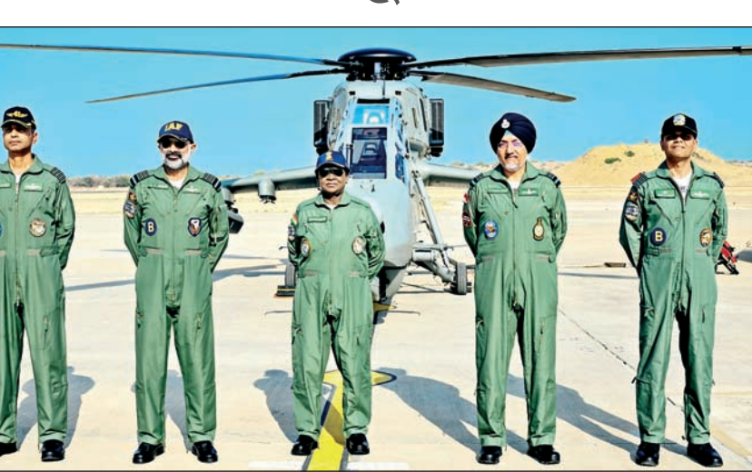
जैसलमेर येथील हवाई तळावर 'प्रचंड'मधून उड्डाण करण्यापूर्वी स्वदेशी वनावटीच्या हेलिकॉप्टरसोबत राष्ट्रपती द्रौपदी मुर्मू, हवाईदल प्रमुख एपी सिंग व अधिकाऱ्यांनी छायाचित्र काढले.