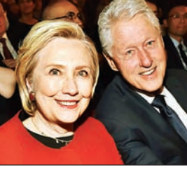
पक्षाच्या नेतृत्वाखालील हाऊस ओव्हरसाइट कमिटी त्यांची चौकशी करणार आहे. हिलेरी यांचे पती आणि माजी राष्ट्राध्यक्ष बिल क्लिंटन यांचीही

मानवी तस्कर जेफ्री एपस्टीनचा मृत्यू होऊन अनेक वर्षे झाली असली तरी, एपस्टीन फाइलसने पुन्हा एकदा अमेरिकेच्या राजकारणात भूकंप आणला आहे. या प्रकरणात आता अमेरिकेच्या माजी परराष्ट्र मंत्री हिलेरी क्लिंटन आणि त्यांचे पती माजी राष्ट्राध्यक्ष बिल क्लिंटन यांच्या अडचणी वाढल्या आहेत. रिपब्लिकन