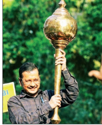
न्यायालयाच्या निर्णयानंतर अरविंद केजरीवाल यांनी रंती काढली

मद्यधोरण प्रकरणातील कथित भ्रष्टाचार प्रकरणातून दिल्लीतील न्यायालयाने शुक्रवारी माजी मुख्यमंत्री अरविंद केजरीवाल, उपमुख्यमंत्री मनीष सिसोदिया यांच्यासह २१ जणांची निर्दोष मुक्तता केली. सीबीआयचे प्रकरण न्यायालयीन सुनावणीत टिकू शकले नाही आणि पूर्णपणे बदनाम झाले, असा संताप न्यायालयाने सीबीआयवर व्यक्त केला. या निर्णयाविरोधात सीबीआयने उच्च न्यायालयात धाव घेतली आहे. निकाल जाहीर झाल्यावर केजरीवाल भावुक झाले होते.