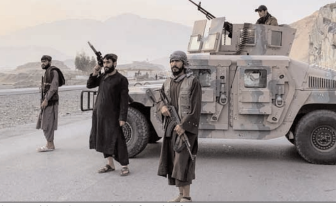
तोखराम सीमेवर तैनात असलेले तालिबानी सैनिक

● दोन्ही देशांचे एकमेकांवर हल्ले ● शेकडो सैनिक ठार; चौक्यांवर ताबा