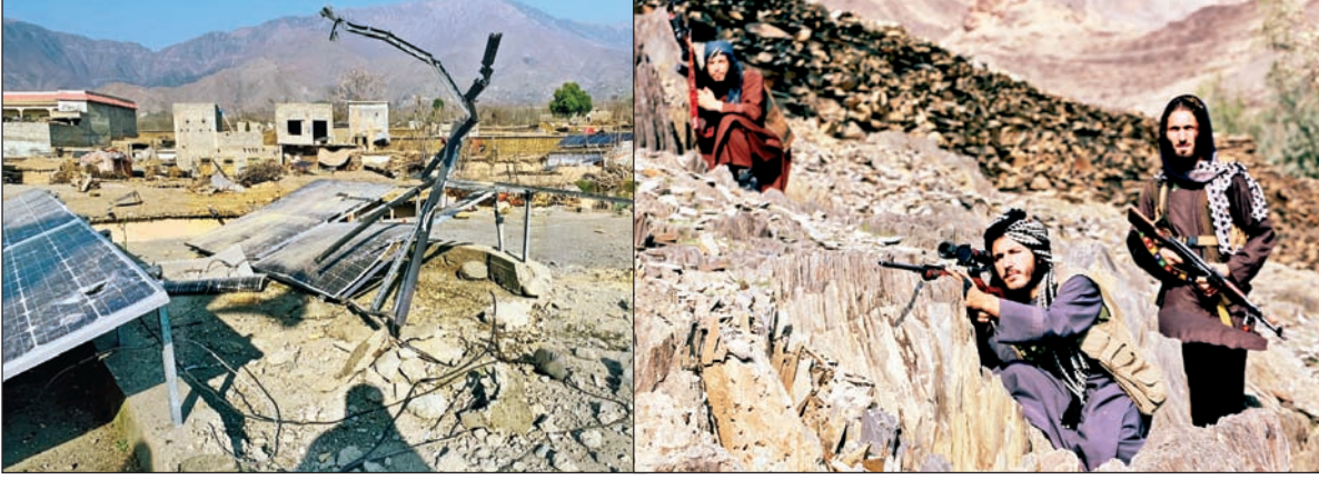
शुक्रवारी मध्यरात्रीपासून अफगाणिस्तान आणि पाकिस्तान यांच्यात भीषण संघर्ष पेटला. अफगाणींच्या माऱ्यात पाकिस्तानच्या वाजोर जिल्ह्यातील सीमवरील एका गावात मोठे नुकसान झाले. पर्वताच्या शिखरावर तेनात असलेले तालिबानी सैनिक