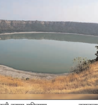
वाढती पातळी कायम राहिल्यास इतिहासकालीन मंदिर आणि दरगाहचे नुकसान होण्याची भीती व्यक्त करण्यात आली.

मोठ्या प्रमाणावर भाविक आणि पर्यटक येत असतात. त्यामुळे या ऐतिहासिक वारशाचे जतन करण्यासाठी तातडीने पाणीपातळी कमी करण्यासाठी प्रशासनाने उपाययोजना कराव्या, अशी मागणी करण्यात आली. याबाबत अद्याप पुरातत्त्व विभागाकडून कोणतीही ठोस कारवाई झालेली नसल्याचा आरोप करण्यात आला आहे. संबंधित विभागांनी संयुक्तपणे लक्ष देऊन मंदिर व दरगाह सुरक्षित ठेवावा आणि भाविकांसाठी ही स्थळे पुन्हा खुली करावी, अशी मागणी करण्यात आली आहे.