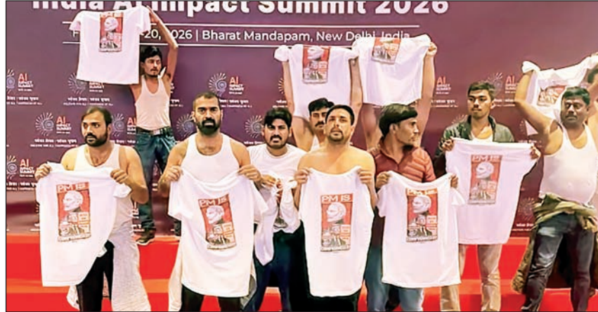
भारत मंडपममध्ये निदर्शन करताना युवक काँग्रेसचे कार्यकर्ते

भारत मंडपम् येथे झालेल्या जागतिक एआय परिषदेच्या व्यासपीठावर युवा काँग्रेसच्या कार्यकर्त्यांनी पंतप्रधान नरेंद्र मोदी यांच्याविरोधात निदर्शन करीत गोंधळ घालला. या घटनेवर भारतीय जनता पक्षाने जोरदार टीका केली असून देशाला बदनाम करण्याचा हा प्रकार राहुल गांधी यांच्या इशान्यावरून झाल्याचे म्हटले आहे. १६ फेब्रुवारीला एआय जागतिक परिषदेला सुरुवात झाली. शुक्रवारी परिषदेचा शेवटचा दिवस होता पण गर्दी आणि कार्यक्रमांमुळे उद्या, शनिवारी समारोप होणार आहे. दरम्यान, शुक्रवारी युवा काँग्रेसच्या १० ते १५ कार्यकर्त्यांनी परिषदेच्या व्यासपीठावर जात शर्ट काढत पंतप्रधान नरेंद्र मोदी यांच्या विरोधात घोषणाबाजी केली. या टी शर्टवर पंतप्रधान मोदी आणि अमेरिकेचे अध्यक्ष डोनाल्ड ट्रम्प