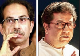
उबाठा आणि मनसे यांच्यात कलगीतुरा रंगला असून ठाकरे