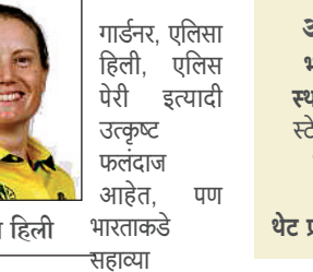
गार्डनर, एलिसा हिली, एलिस पेरी इत्यादी उत्कृष्ट फलंदाज आहेत, पण भारताकडे सहाव्या

आजचा सामना भारत वि. ऑस्ट्रेलिया स्थळ : एसीए-व्हीडीसीए स्टेडियम, विशाखापट्टणम वेळ : सप्टेंबर ३, ०० वाजतापासून थेट प्रसारण : स्टार स्पोर्ट्सवर