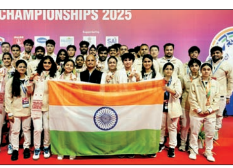
कांस्यपदक विजेता भारतीय कनिष्ठ बॅडमिंटन संघ

गुवाहाटी, ११ ऑक्टोबर बतावाच चीन बॅडमिंटन संघाने शनिवारी येथे झालेल्या जागतिक कनिष्ठ बॅडमिंटन अजिंक्यपद स्पर्धेच्या मिश्र सांघिक अंतिम सामन्यात गतविजेत्या इंडोनेशियाला २-० असे हरवून १५ व्यंदा सुहार्दानाता चषक जिंकला.