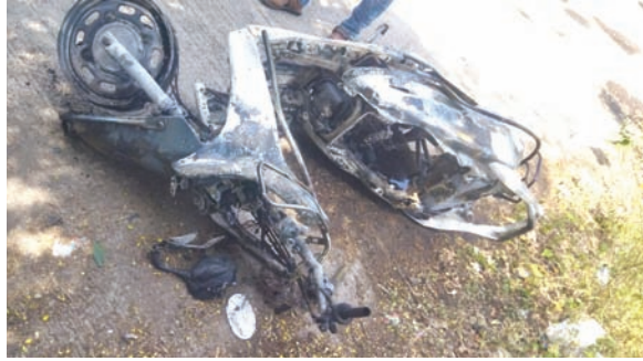
तरुणांना पोलिसांनी चौकशीसाठी ताब्यात घेतले. प्रत्यक्षदर्शीच्या माहितीनुसार बाहेर गावाहून आलेल्या संशयित मुस्लिम तरुणाने अन्य बाहेर गावातून हिंदू मुलीला सोबत शहरात आणले. त्यानंतर मोपेडवरून ते दोघे मोहाडी रोडवरील लांडोखरी उद्यानात नेले.

येथे ते बराच वेळ एकांतात वावरले. मोपेडने मुलगी आणि संशयित तरुण उद्यानाकडून शहराकडे निघाले. पेट्रोलपंपाच्या पुढे रस्त्याच्याकडेला मोपेड लावून हा तरुण एका दुकानावर खाद्य पदार्थ घेण्यासाठी आला. याठिकाणी काही जणांनी दोघांची विचारपूस केली असता संशयित तरुणाने अरेरावीची भाषा केली. त्यानंतर हा लव जिहादचा संशय बळावला. गर्दातील तरुणांनी संशयिताला मारहाण करण्यास सुरुवात केली. तसेच त्याची मोपेड पेटविली. एमआयडीसी पोलिसांनी परिसरात घटनेबद्दल प्रकार जाणून घेण्याचा प्रयत्न केला.