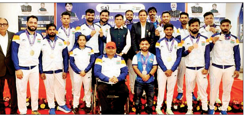
पदकविजेत्यांच्या सत्कार प्रसंगी क्रीडा मंत्री मनसुख मांडवीया व इतर मान्यवर