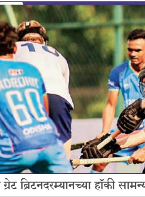
भारत आणि ग्रेट ब्रिटनदरम्यानच्या हॉकी सामन्यातील एक अटीतटीचा क्षण

आजचा सामना भारत वि. ऑस्ट्रेलिया स्थळ : एसीए-व्हीडीसीए स्टेडियम, विशाखापट्टणम वेळ : सप्टेंबर ३, ०० वाजतापासून थेट प्रसारण : स्टार स्पोर्ट्सवर